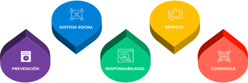
Figura 1. Valores organizacionales del DSPR (Fuente: Plan Estratégico del DSPR 2020-2025)

Como parte del ejercicio de definición de los nuevos lineamientos filosóficos que dirigirán la gestión del DSPR a futuro, se definieron una serie de valores organizacionales y principios guías sobre los cuales deberán descansar las actuaciones de la agencia. Primeramente, se definieron los cinco valores organizacionales que deberá fundamentar el accionar institucional: prevención, justicia social, responsabilidad, confianza y respeto. Acto seguido, se establecieron los cinco principios guías que dirigirán el camino a seguir para las referidas acciones: el derecho a la salud, mejora continua, equidad en salud, gobernanza y esfuerzos informados por la evidencia. Las Figuras 1 y 2 presentan gráficamente los discutidos lineamientos.