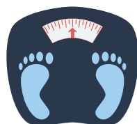
Personas con sobrepeso/obesidad