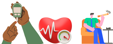
Personas con condiciones preexistentes