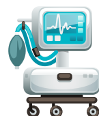
Sea conectada a un respirador