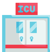
Sea admitida a la unidad de cuidados intensivos