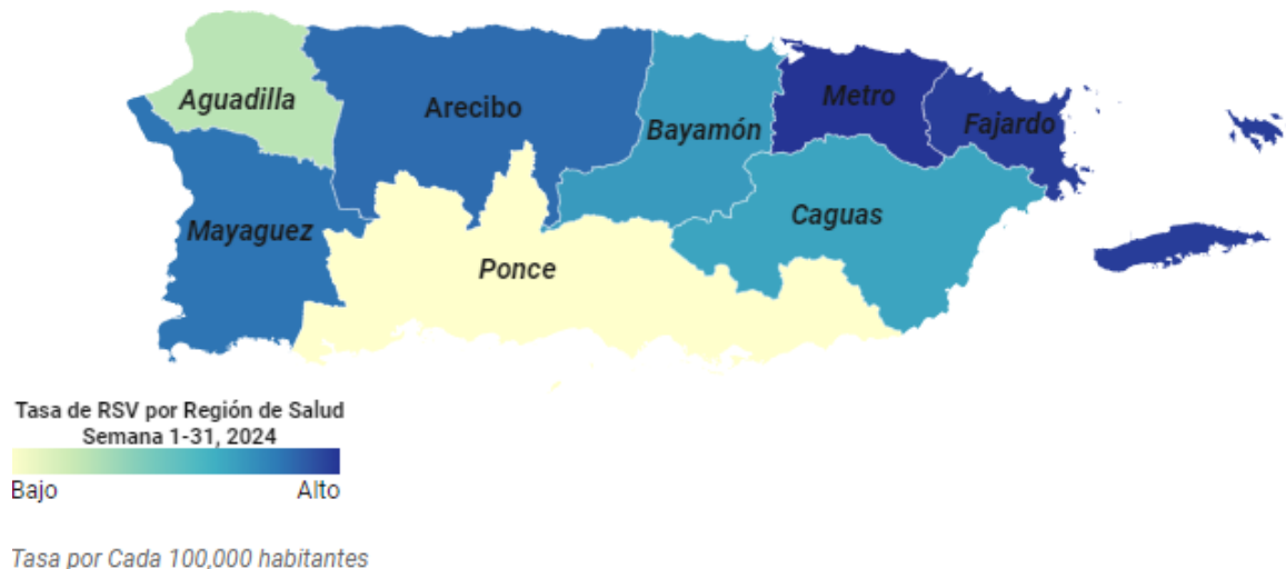
Figura 2: Mapa: Tasa de Incidencia acumulada de casos por región de Salud, Puerto Rico, año 2024

La figura 2 presenta el mapa de Puerto Rico con las tasas de incidencia acumulada de los casos de VRS por regiones de salud para las semanas epidemiológicas 1 – 31 de 2024. Las tasas de incidencia más alta se observan en las regiones de Metro ( 13.2 x 100,000 habitantes), seguido de la región de Fajardo ( 13 X 100,000 habitantes), Arecibo ( 12 X 100,000 habitantes), y Mayagüez ( 11.8 X 100,000 habitantes) respectivamente.